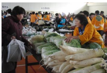
石鳥谷福祉バザー