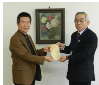
シニア大学自治会 様(左)