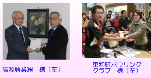
高源興業(株) 様(左) 東和町ボウリングクラブ 様(右)

編集後記 資格取得のためレポート課題があります。いつもなら細かい注意事項があり、指定文字数内にまとめられない!と苦勞していましたが、今回は「家族と社会福祉の関係」とテーマがあるだけで特に縛りがなく、採点は「オリジナリティ重視」とのこと。何でもいと言われると余計に何を書いたら良いかわからず・・・未婚の理由でも延々と書こうかな。きっとオリジナリティあふれるレポートが書けると思うのですが。先日、弟が結婚報告したときの祖母の嬉しそうなお顔が忘れられません。私はいつになることやら。ごめんよ、ばあちゃん!(直)