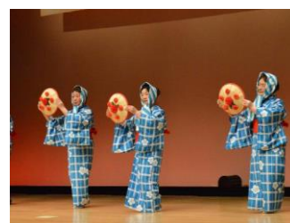
大迫地域歳末たすけあい芸能大会