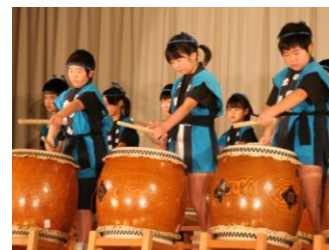
東和地域歳末たすけあい芸能大会