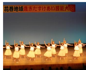
花巻地域歳末たすけあい芸能大会