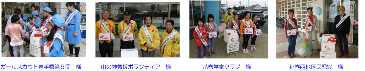
ガールスカウト岩手県第5団 様 山の神救援ボランティア 様 花巻学童クラブ 様 花巻西地区民児協 様

10月1日から11月7日のうち9日間、市内12カ所で街頭募金運動を行いました。街頭募金には市内の学童クラブ・中高校生をはじめ民生児童委員、ボランティア団体、市民活動団体など40団体、396名の皆様にご協力いただきました。募金いただいた市民の皆様、街頭募金運動にご協力いただいたボランティアの皆様の温かいお気持ちに心から感謝申し上げます。誠にありがとうございました。 赤い羽根共同募金運動は、街頭募金のほか、戸別募金・法人募金・学校募金・職場募金など運動が行われ、多くの皆様からたくさんの善意の募金が寄せられました。