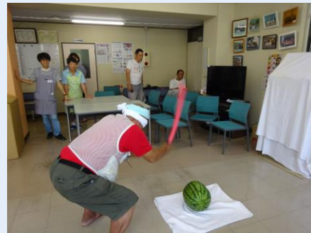
スイカ叩きの一場面