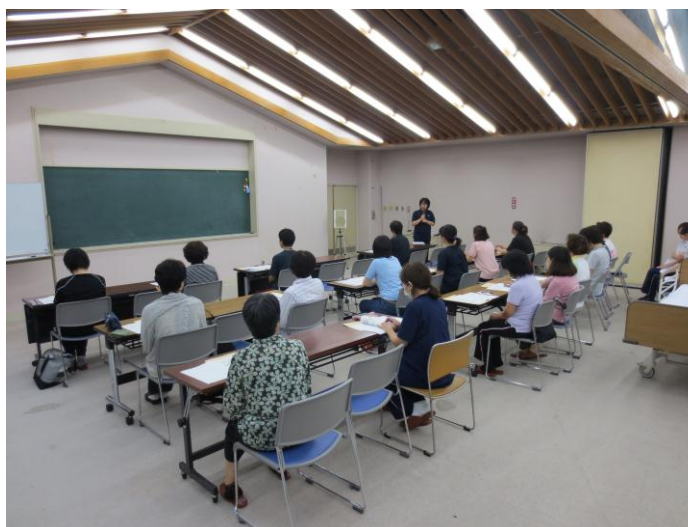
←前回のおさらい会の様子