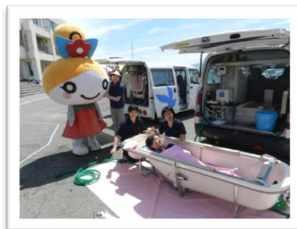
(平成 28 年 5 月 2 8 日 (土) 石鳥谷生涯学習会館、福祉まつりの様子)

在宅福祉課からは、訪問入浴車のデモンストレーションを行い、会場内では他にも、車椅子に乗っての体験コーナーや屋台など、ご来場の方々に楽しく過ごしていただくことが出来ました。