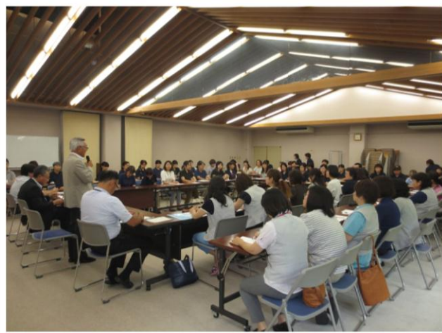
(平成 28 年 8 月 1 日 (月) 研修会での様子)