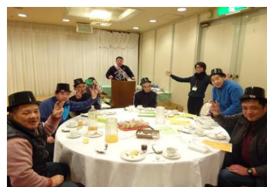
おそろいの帽子での1枚 盛り上がったカラオケ&ダンス！