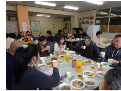
もち料理のフルコース！