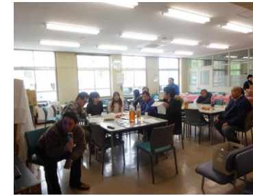
美声響くカラオケ会場