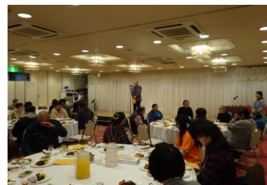
1年を振り返った施設長あいさつ

おかげさまで1年の締めこむさわしい大忘年会になりました。参加された皆さん、お疲れ様でした！