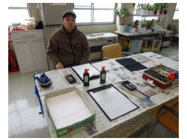
何を書こうか？書道会場

年が明けて1月14日(土)、新年会を行いました。参加者は利用者さん、職員で総勢36名でした。新年早々大変多くの方に参加していただきました。恒例の餅つきでは、多くの皆さんに参加していただき、おかげさまでとっても柔らかくおいしいお餅に仕上がりました。会食メニューは、5種類(お雑煮、あんこ、ごま、くるみ、大根)のお餅料理に、ちらし寿司など。とてもおいしかったですね！