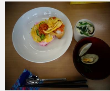
前回のひなまつりメニューです。