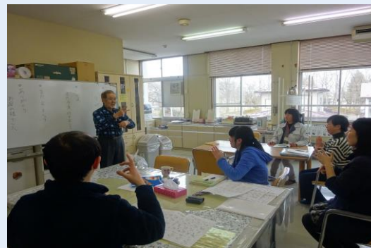
熱心に手話に取り組む参加者の皆さん

H29年度も5月からスタート予定です。日常生活でよく使うことば・表現を中心に学ぶ予定です。新しい季節に新しい何かを始めてみたい方、一緒に手話を覚えてみませんか？