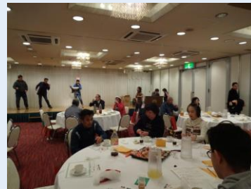
会場は満員御礼でした。

後半は豪華景品をかけたくじ引きからスタート！今回も年末年始に楽しめる内容の景品（保存のきく食べ物・飲み物）を準備しました。他、参加者の皆さんに当日作っていただいたクリスマスカードも封入しました。メインイベントの仮装カラオケ大会では皆さんの持ち歌の披露、楽しい創作ダンス、ナチュラルムーブによるダンス発表など、今回も大盛り上がりでした。