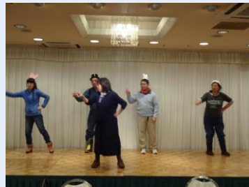
ナチュラルムーブのダンス