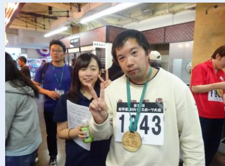
選手とボランティアさんとの1枚