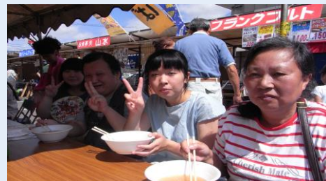
美味しかったです！釜石ラーメン