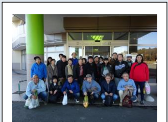
昨年の集合写真です。