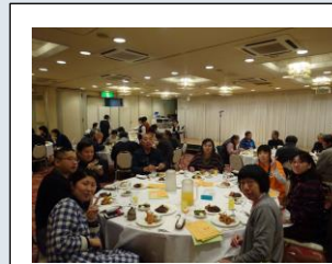
毎年多くの方に参加 いただいています！