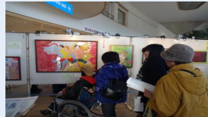
様々な作品が展示されていました。