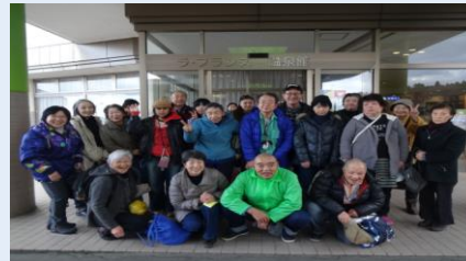
ラ・フランス温泉にて

普段よりもゆったりとしたプランでしたが、多くの方からご好評の声をいただきました。参加者の皆さん、お疲れさまでした。