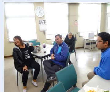
カラオケも盛り上がりました