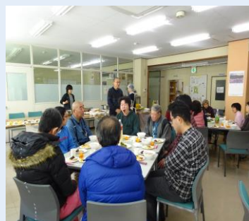
利用者さんが大集合！