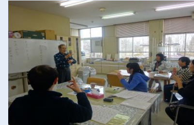
このような雰囲気で行っています。 終了後はお菓子で囲っています。