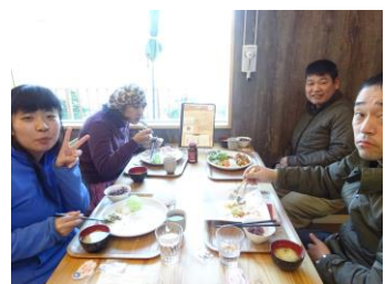
美味しいご飯でした