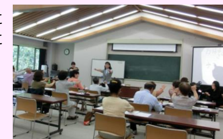
平成25年度「障がい福祉サービスについて」の講話の様子