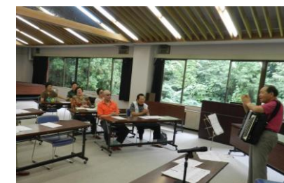
平成25年度「懐かしい歌」の講座の様子

申し込み 花巻市社会福祉協議会本所まで電話・FAX・ハガキのいずれかでお申し込みください。 花巻市石神町364番地 電話 24-7222 FAX 22-4283