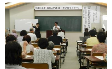
満員御礼! 平成25年度 青い鳥セミナー