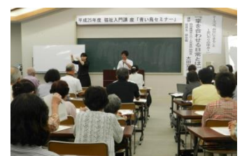
満員御礼! 平成25年度 青い鳥セミナー