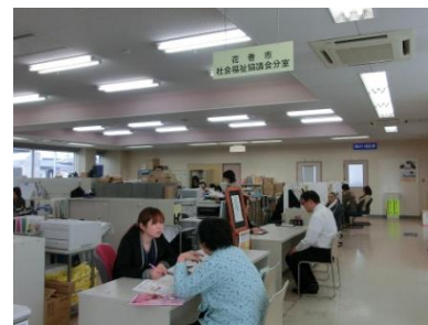
移設した相談窓口

これまで、本会の相談窓口に来られても、相談内容によっては市の相談窓口に行ってくださいようお願いしたり、その逆のケースも多くあり、来談された皆様にご負担をかけていた訳ですが、ワンフロアー化されたことで今まで以上に市の相談窓口との連携を図ることができるなど、相談の早期解決への体制を強化いたしました。