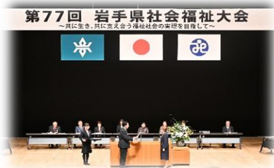
岩手県社会福祉大会参加