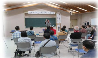
共に生きる講演会