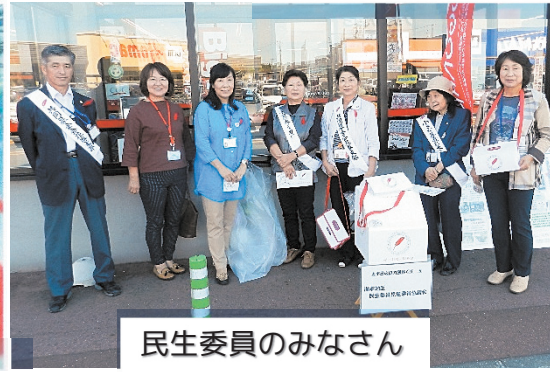
民生委員のみなさん