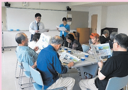
東日本大震災被災者(市内在住)を対象とした「絆」かだる(語る)カフェ事業