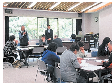
事例検討グループワーク

日時 11月9日(木) 9:50~15:30 10日(金) 10:00~15:30 場所 花巻市総合福祉センター 形態 講義(演習を含む) 内容 花巻市のボランティアの現状や課題、介護保険の状況など花巻市の「今」がわかる内容、ボランティアの心構え、心肺蘇生法やコミュニケーションの手法など、実用的な内容を学びます。