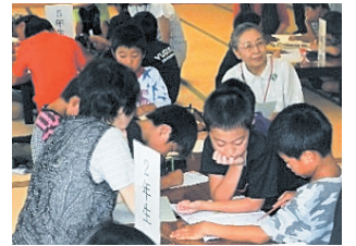
学年毎のグループで取り組み