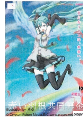
赤い羽根共同募金 Illustration by 6.6 © Cryston Future Media, Inc. www.piapro.net/piapro