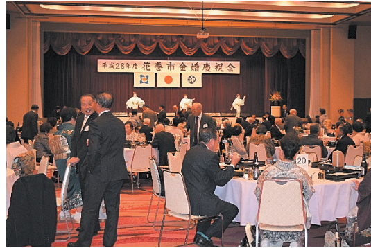
昨年度の金婚慶祝会 祝賀会の様子

結婚50周年を機に、今日までの社会への貢献と活躍に敬意を表するため、金婚慶祝会を開催いたします。