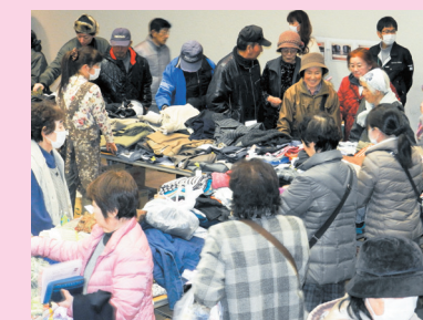
花巻地域福祉バザーの様子

12月3日(日) 10:00~14:00 花巻市文化会館 中ホール・展示ホール 家具、衣類、雑貨、市内福祉施設の製品など 11月22日まで 家具の運搬もいたします(要予約) ※衣類・雑貨が大量の場合は下記までお問合せください 花巻市社会福祉協議会本所 TEL 24-7222 FAX 22-4283