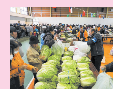
石鳥谷地域福祉バザーの様子

11月18日(土) 10:00~12:00 ビバハウスいしどりや 衣類、雑貨、食料品など 当日の9:00まで 衣類・雑貨も提供願います 花巻市社会福祉協議会石鳥谷支所 TEL 45-4666 FAX 46-1171