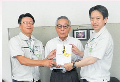
(株)アイオー精密 様 (写真、右・左)