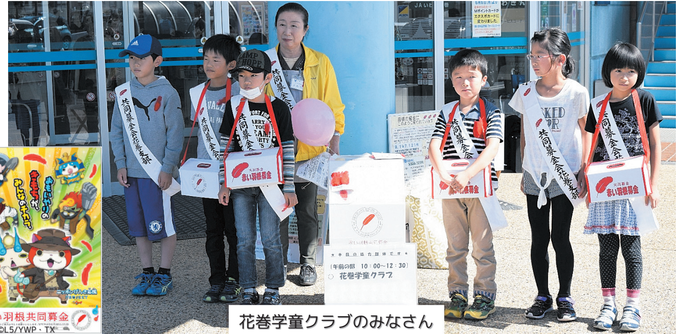
花巻学童クラブのみなさん