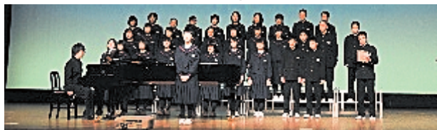
福祉推進校実践発表