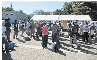
大仙市災害ボランティアセンター受付の様子

現地での災害VCの運営支援内容は、主に資材管理や活動するボランティアの送迎に従事し、全国の多くのボランティアの皆様から、活動のご協力をいただきました。