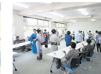
ふれあい昼食会(田瀬地区)