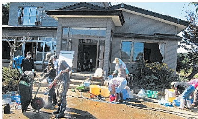
家屋からの泥出しの様子