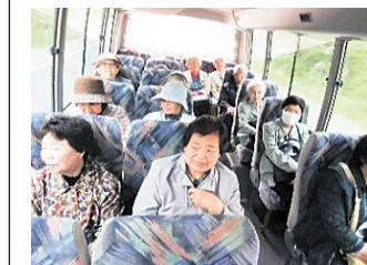
いろいろの会の様子