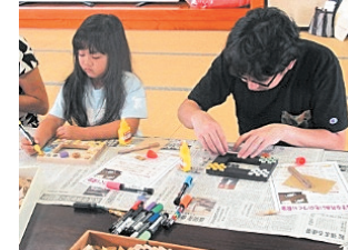
写真立てづくりの様子

参加者からは「夏休みのいい思い出となりました」との感想も聞かれ、親子で楽しい時間を過ごしていただくことができました。