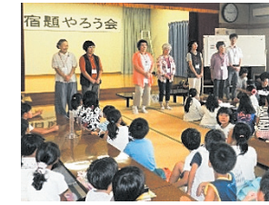
学習支援ボランティアの紹介

湯口地区教員OBの皆様をはじめ、地区外からも学習支援のボランティアにご協力いただきました。ありがとうございました。