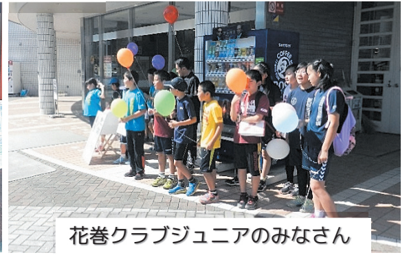
花巻クラブジュニアのみなさん