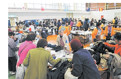
石鳥谷福祉バザー