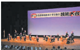
昨年度の花巻地域の様子

この益金は支援を必要とする人たちへ歳末たすけあい義援金の一部として活用されます。歌や舞踊、趣味や特技など練習の成果を披露してみませんか？ 皆様のご応募をお待ちしております。