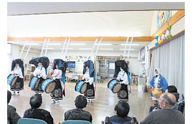
デイサービスの誕生会

介護予防支援センターでは、様々な相談内容に対応するとともに、介護予防や認知症支援に関する周知啓発や多職種、関係機関のネットワークの構築を行いました。