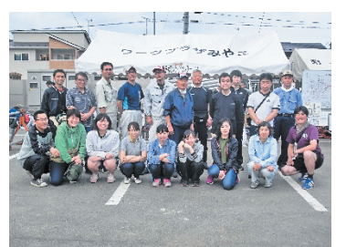
岩手県台風10号岩泉町被災地支援 第1次ボランティアバス

一方、経営基盤の強化に向け、効率的・効果的な事業運営に努め、平成29年4月1日日本格施行の社会福祉法の一部改正に向けた準備・整備を進めました。