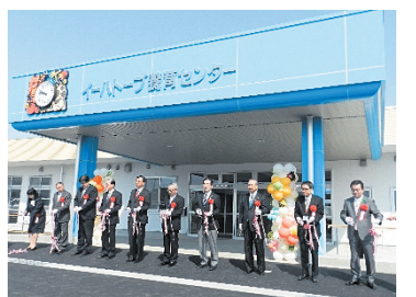
イーハートブ養育センター 新築移転開所式

就労継続支援B型事業では、工賃向上計画に基づき、利用者の目標工賃を達成しました。