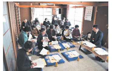
仲町地区地域福祉懇談会

生活困窮者自立支援制度に基づく事業は、身近な相談窓口として、出張相談や市民への周知としてチラシを全戸に配布したほか、フードバンク対応を充実させるなど多様な支援を展開しました。