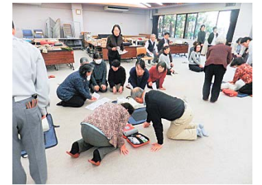
ボランティア養成研修 (基礎編・救急救命)

基本研修を 3 回、事業者向け研修を 2 回実施し、合計 123 名の方が研修を修了いたしました。 研修を修了いただいた方々は、それぞれの地域で生活支援ボランティア団体に登録でき、地域での活躍できるしくみとなっています。