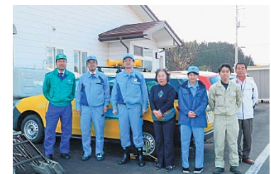
ご協力いただいた皆さん