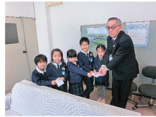
大谷幼稚園 湯口大谷幼稚園 様