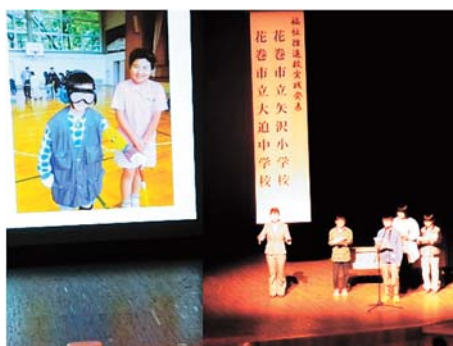
福祉推進校実践発表（矢沢小学校）