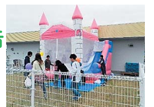
ふわふわエア遊具