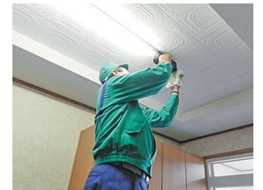
蛍光灯の点検・清掃

今年度は太田・笹間地区にお住いの方々を対象とし、希望者の取りまとめを民生委員児童委員の皆様にご協力いただきました。当日は本会職員も同行し 13 名の方々のお宅で活動させていただきました。 対象者からは「日頃は電球交換で精一杯だった。グロー球の交換まで手が回らなかったのととても助かった。」「配電盤の漏電点検も、自分ではできないので点検してもらって良かった。」など好評でした。この活動は、来年度以降も実施を予定しております。 ご協力いただいた皆様、大変ありがとうございました。