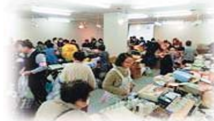
花巻地域福祉バザーの様子