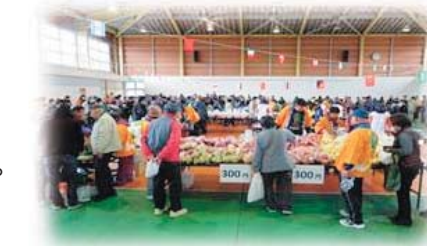
石鳥谷地域福祉バザーの様子