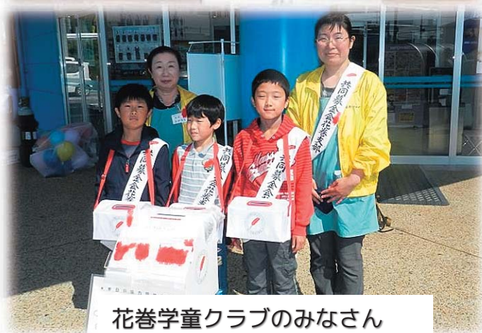
花巻学童クラブのみなさん