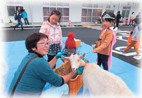
動物ふれあいコーナー

日時 平成30年10月13日(土) 午前10時～午後2時 場所 イーハトーブ養育センター (花巻市不動町1-1-2) 問合せ イーハトーブ養育センター TEL 21-3771 花巻市社会福祉協議会 地域福祉課 TEL 24-7222