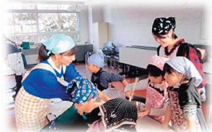
花巻子ども劇場の親子ふれあい体験の様子(昨年度)