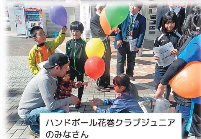
ハンドボール花巻クラブジュニアのみなさん