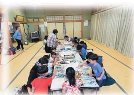
児童ふれあいものづくり教室の様子