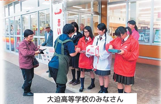
大迫高等学校のみなさん