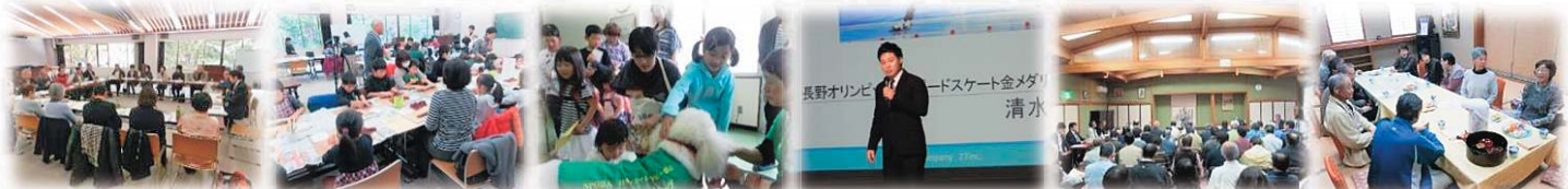
見守り安心事業 児童ふれあい交流 福祉まつり開催 花巻市社会福祉大会 地域福祉懇談会 「絆」かだるカフェ