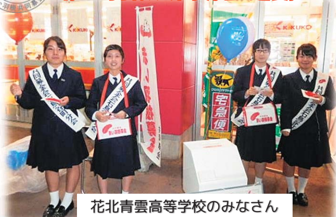
花北青雲高等学校のみなさん

～じぶんの町を良くするしくみ。～ 赤い羽根共同募金運動にご協力をお願いいたします。