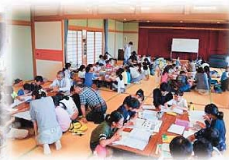
宿題やろう会の様子