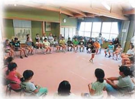
キッズ・わくわくスクールの様子