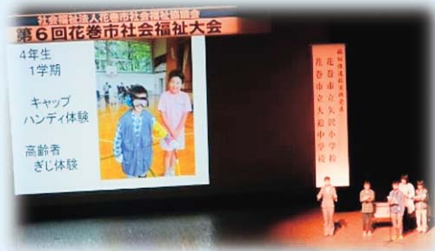
昨年度の福祉推進校実践発表 (花巻市立矢沢小学校)