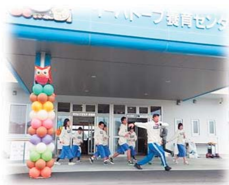
開会セレモニーの様子