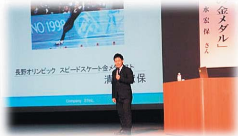
第 6 回花巻市社会福祉大会で講演する講師の清水宏保氏

社会福祉協議会は、地域住民の皆様、社会福祉関係者等の参加と協力を得て活動するのを大きな特徴とし、民間組織としての自主性と広く住民の皆様や社会福祉関係者に支えられた公共性という二つの特徴を持ち、社会福祉法第 109 条に位置づけられた地域福祉推進を目的とした組織です。