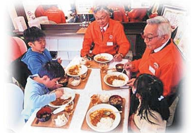
ぬくまる食堂の開催

社会福祉法人花巻市社会福祉協議会（以下「本会」という。）は、社会福祉法第 109 条に位置づけられている組織として、地域福祉を推進し、花巻市民が安心して自立した生活ができるまちづくりをめざし、市民や社会福祉の関係者などの参加・協力により、豊かな福祉社会づくりに努めます。