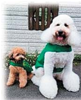
アニマルセラピー体験