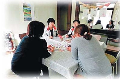
ふらっとカフェ事業の実施

※1 認知症などの家族を介護している方が、気軽に日頃の介護の疑問や困っていることなどを話せる場所、リフレッシュできる場所として月 1 回社協サテライトスペースで開催。