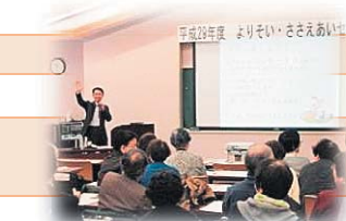
よりそい、ささえあいセミナー