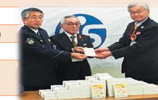
詐欺防止啓発ハガキ引渡式