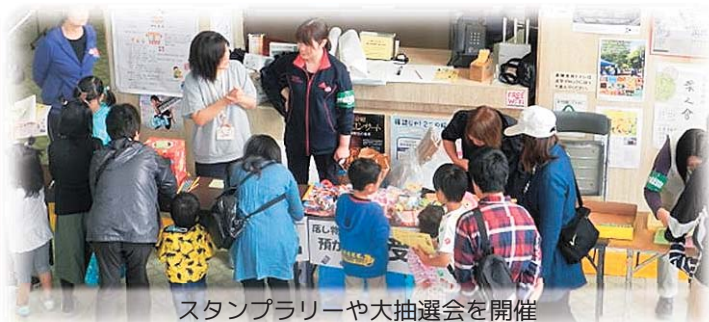
スタンプラリーや大抽選会を開催