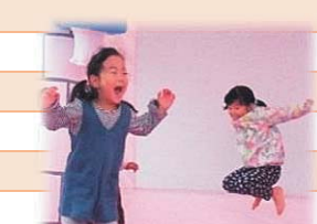
わんぱく子どもフェスティバル