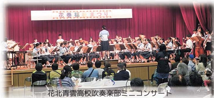
花北青雲高校吹奏楽部ミニコンサート