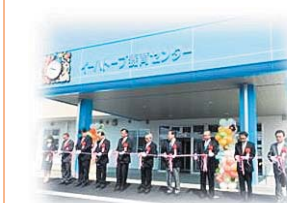
児童発達支援センターイーハートブ養育センター