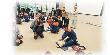
生活支援ボランティア養成研修の実施