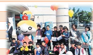
赤い羽根共同募金街頭募金