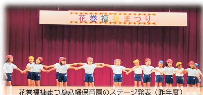
花巻福祉まつり八幡保育園のステージ発表（昨年度）