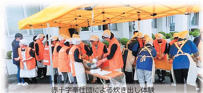
赤十字奉仕団による焼き出し体験