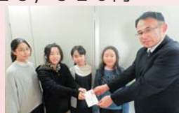
(写真) 南万丁目かせ踊り保存会様