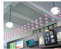
花巻駅の軒花飾り

当事業所での軒花の売上げは、障がい者の方々の工賃として、貴重な収入源となっています。ぜひ、この機会にご用命ください。