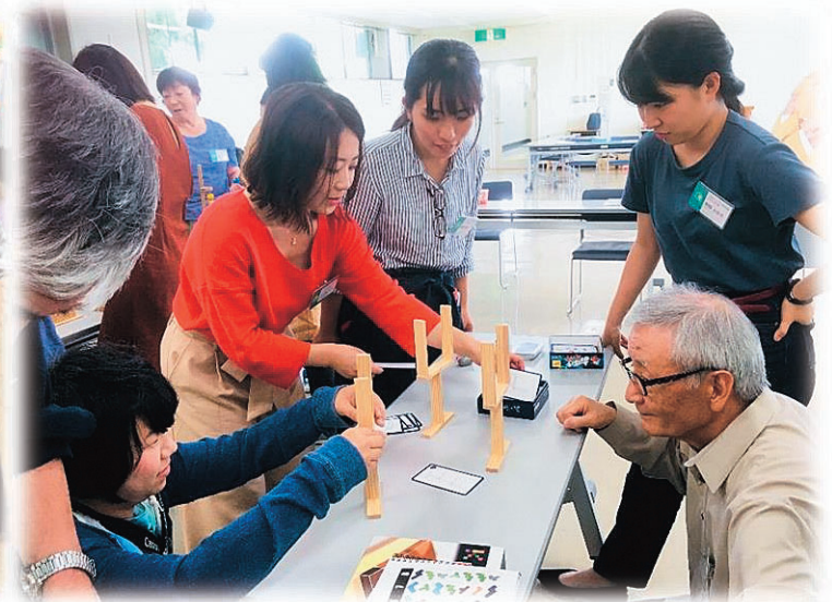
第1期 おもちゃ学芸員養成講座の様子