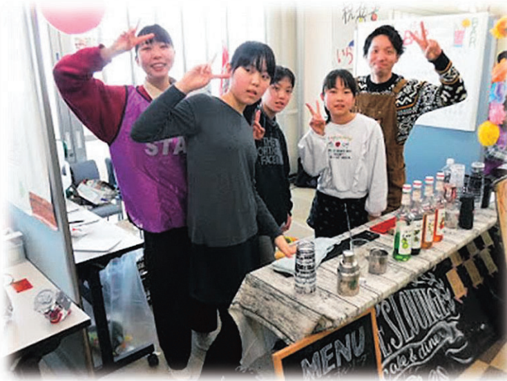
「未来町」のカクテルバー屋を体験する子どもたち