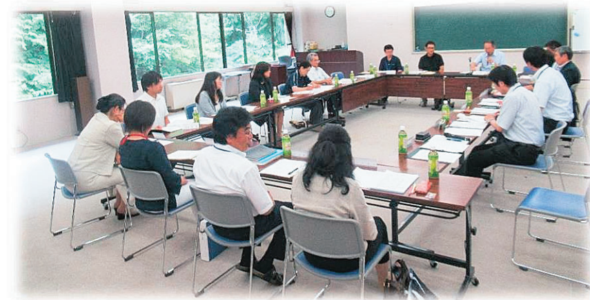
平成30年に開催された検討委員会のようす