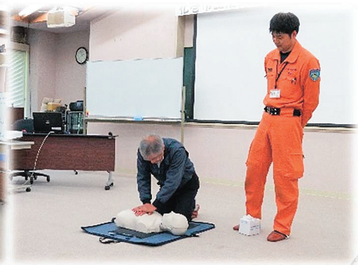
「心肺蘇生法について」の様子