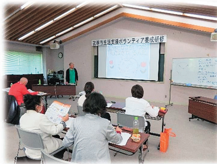
「認知症の理解（認知症サポーター養成講座）」の様子