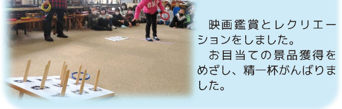
映画鑑賞とレクリエーションをしました。お目当ての景品獲得をめざし、精一杯がんばりました。