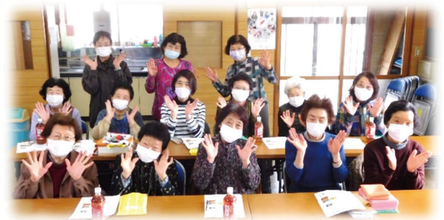
女性交流の会の皆様の様子

石鳥谷地域で活動しているサロン53団体の中から、今回は『女性交流の会』様の活動をご紹介します。サロンは、地域のみなさんが互いに支え合いながら楽しく元気に交流できる居場所になっています。活動の内容は、元気でもっと体操で健康維持に努めている他、折り紙や刺し子等をおして、みんな笑顔で楽しく活動しています。