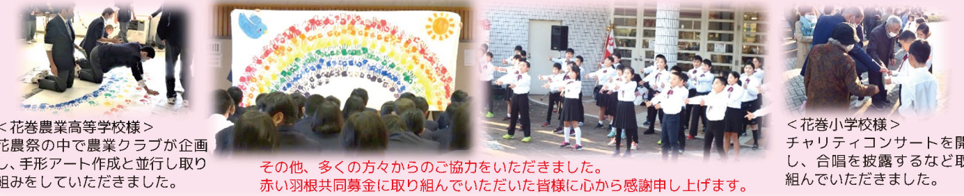
<花巻農業高等学校様> 花巻祭の中で農業クラブが企画 し、手形アート作成と並行し取り 組みをしていただきました。