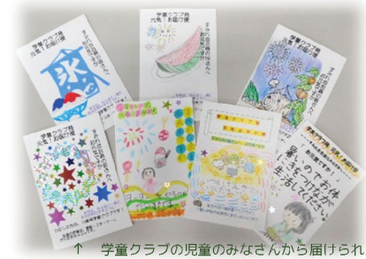
↑ 学童クラブの児童のみなさんから届けられた元気いっぱいの絵はがき

コロナ禍で、一人暮らし高齢者等の外出や、交流機会が制限される状況の中、うるおいのある生活や地域内でのつながりが実感できるように、地域の学童クラブの協力のもと、児童からの元気いっぱい応援メッセージを送りました。