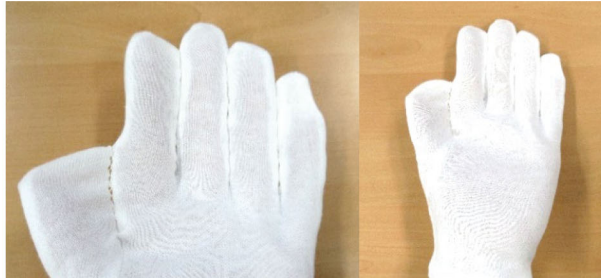
5本の指を縫い合わせて、指を開かない状態にします。