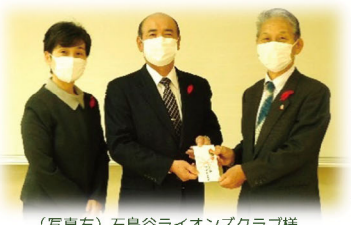
(写真右) 石鳥谷ライオンズクラブ様

社協石鳥谷支部では、多くの皆様から心温まる支部事業指定寄付をいただいております。掲載の写真は石鳥谷ライオンズクラブ様からの贈呈の様子ですが、その他の方のご紹介は4ページに掲載しています。