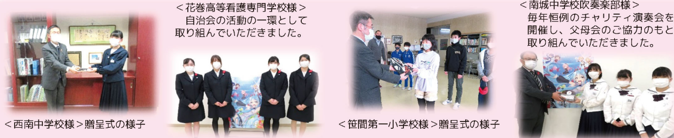
<花巻高等看護専門学校様> 自治会の活動の一環として 取り組んでいただきました。