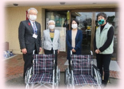
(写真) 岩手県退女教裨貴支部花巻支会様