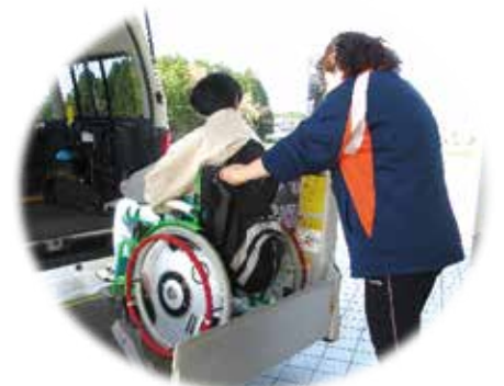
障害者基準該当生活介護事業 矢沢地域福祉センターの様子（昨年度）

★障がい者のための共生社会の実現に向けた、就労継続支援B型事業を実施したほか、関係機関との連携や相談機能の強化に努め、障害者相談支援事業を実施するとともに、地域活動支援センターにおける各種活動を通じて、社会との交流促進支援に努めました。