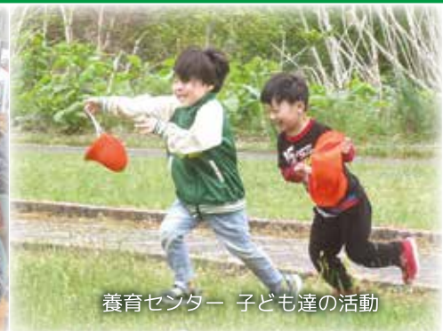
養育センター 子ども達の活動