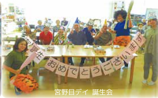
宮野目デイ 誕生会