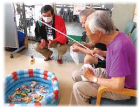
宮野目デイサービス夏まつりの様子（昨年度）

★介護予防事業では、多種多様な相談への対応や、介護予防や認知症支援に関する周知・啓発を行ったほか、関係機関との連携に努めました。