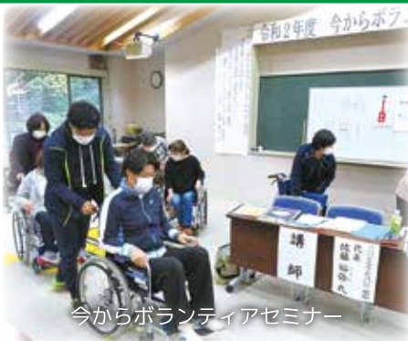
今からボランティアセミナー