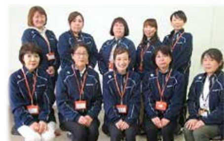
地域福祉訪問相談員（今年度）