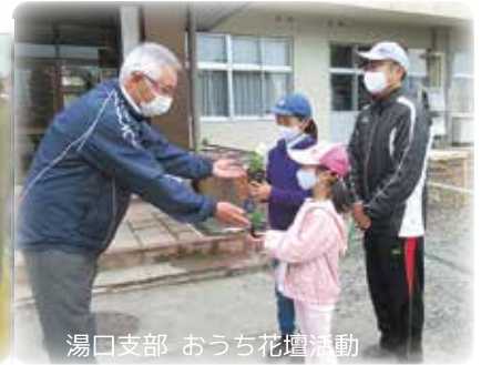
湯口支部 おうち花壇活動