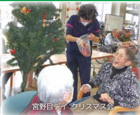
宮野目デイ クリスマス会