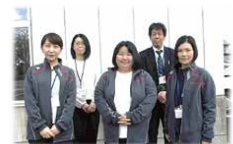
総合相談室相談員（今年度）