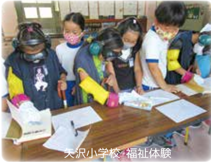
天沢小学校 福祉体験

○大迫支所 〒028-3203 花巻市大迫町大迫第13地割23番1 TEL.0198-48-4111 FAX.0198-48-4085 ○石鳥谷支所 〒028-3101 花巻市石鳥谷町好地第6地割10番地3 TEL.0198-45-4666 FAX.0198-46-1171 ○東和支所 〒028-0115 花巻市東和町安俵6区71番地 TEL.0198-42-3151 FAX.0198-42-3816