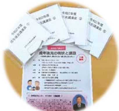
成年後見講演会（DVD 貸出し中）