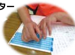
令和2年度の養成講座の様子