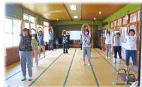
北湯ローはつらつクラブのサロン活動様子（昨年度）