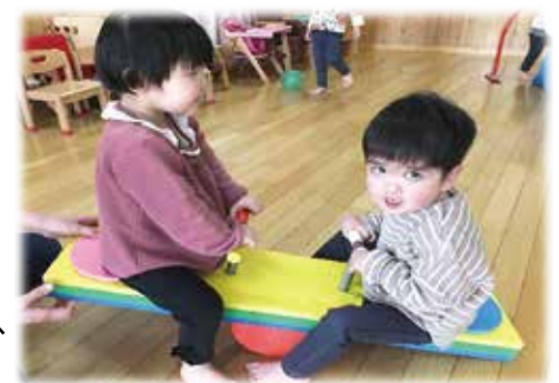
養育センターでの活動の様子（昨年度）

★福祉人材の確保や職員定着のために、処遇改善を前年度に引き続き実施したほか、働き方改革関連法に対応した取り組みや、新型コロナウイルス感染症予防対策を進め、ワークライフバランスや職場環境の改善に努めました。