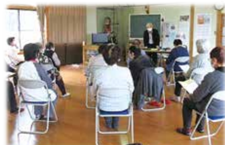
湯本地区域福祉懇談会の様子（昨年度）

★地域ケア会議の開催や、地域におけるネットワーク活動の促進を図りながら、地域包括ケアシステムの構築に向けた事業を実施しました。