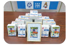
特殊詐欺被害防止対策