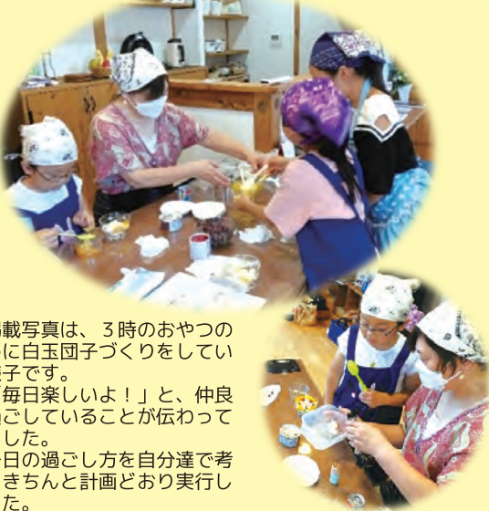
掲載写真は、3時のおやつのために白玉団子づくりをしている様子です。 「毎日楽しいよ!」と、仲良く過ごしていることが伝わってきました。 一日の過ごし方を自分達で考え、きちんと計画どおり実行しました。

花北地域の児童見守り活動として、夏休み期間に子ども達の支援をされていた地元企業の活動をご紹介します。