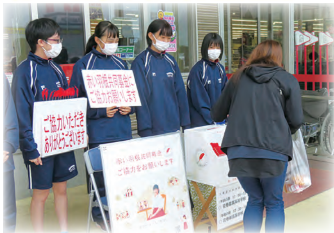
花巻農業高等学校の生徒のみなさん