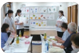
「絆」かだる(語る)カフェ事業