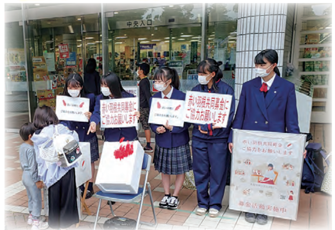
花巻南高等学校の生徒のみなさん

10月1日から全国一斉に、市民のやさしさや思いやりを届ける、「 じぶんの町を良くするしくみ 」として、赤い羽根共同募金運動が始まります。