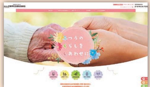
花巻市社会福祉協議会ホームページ

本会の事業紹介や報告のほか、地域で活動されている福祉団体の活動紹介などの情報を発信することで、少しでも多くの皆さまに「ふくし」を身近に感じていただけるよう、随時新しい情報をお伝えしていきます。