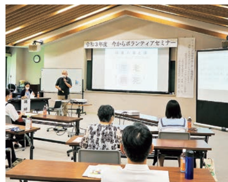
今からボランティアセミナーの様子