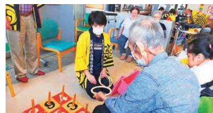
宮野目デイサービスセンター活動の様子