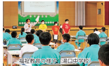
福祉教育の様子（湯口中学校）