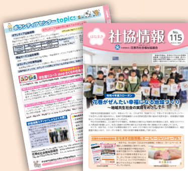
はなまき社協情報

本会では、年6回の「はなまき社協情報」の発行と本会「ホームページ」による情報発信に努めています。