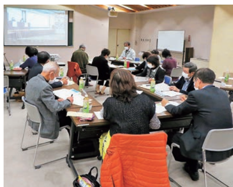
日常生活自立支援事業研修会の様子