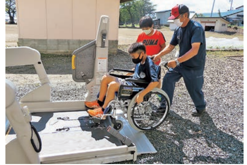
車いす・送迎車両乗車体験の様子 (笹間第二小学校)