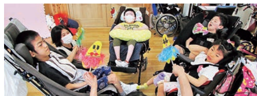
多機能型事業所こすもす活動の様子