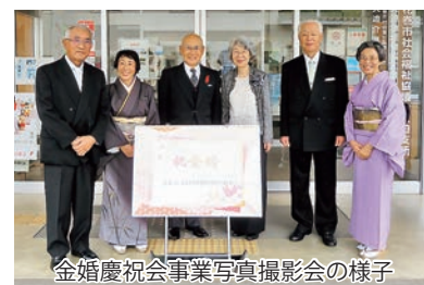
金婚慶祝会事業写真撮影会の様子