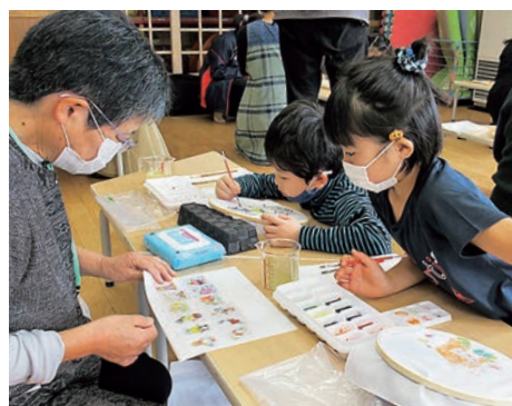
（湯本）世代間交流事業色さし体験の様子