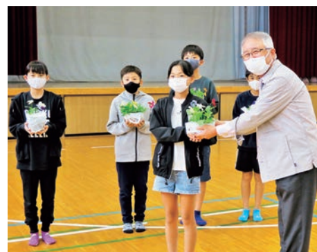
（湯口）児童支援事業花苗配布の様子