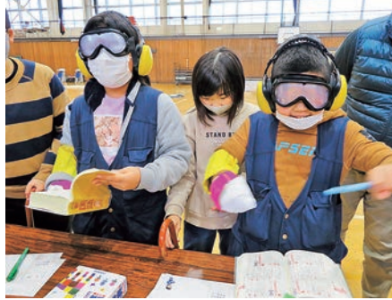
高齢者疑似体験の様子 (八重畑小学校)