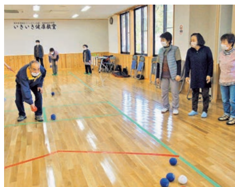
出前講座ボッチャ体験の様子

※1 空き店舗を活用し、様々な相談等に利用できる「居場所」として、身近に市民が集うことができるスペース