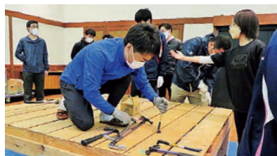
青い鳥セミナー 「災害ボランティア養成講座」 床板はがしの様子