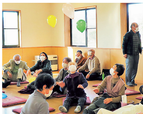
（笹間）轟木上ふれあいサロン活動の様子