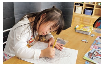
イーハートブ養育センター活動の様子