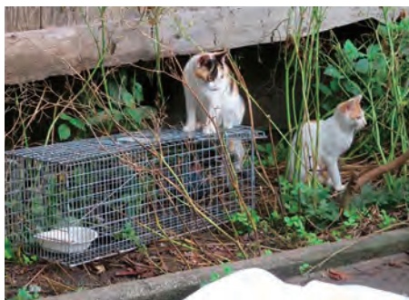
捕獲のためにゲージを設置

また、多頭飼育崩壊となったお宅へ出向き、繁殖を防止するために、不妊去勢手術推進のための捕獲や病院への送迎および術後の見守りなど、多様な問題を抱えたペットを一時保護する活動も行っています。