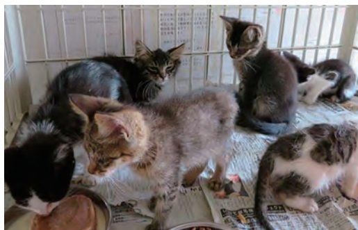
捕獲された子猫たち