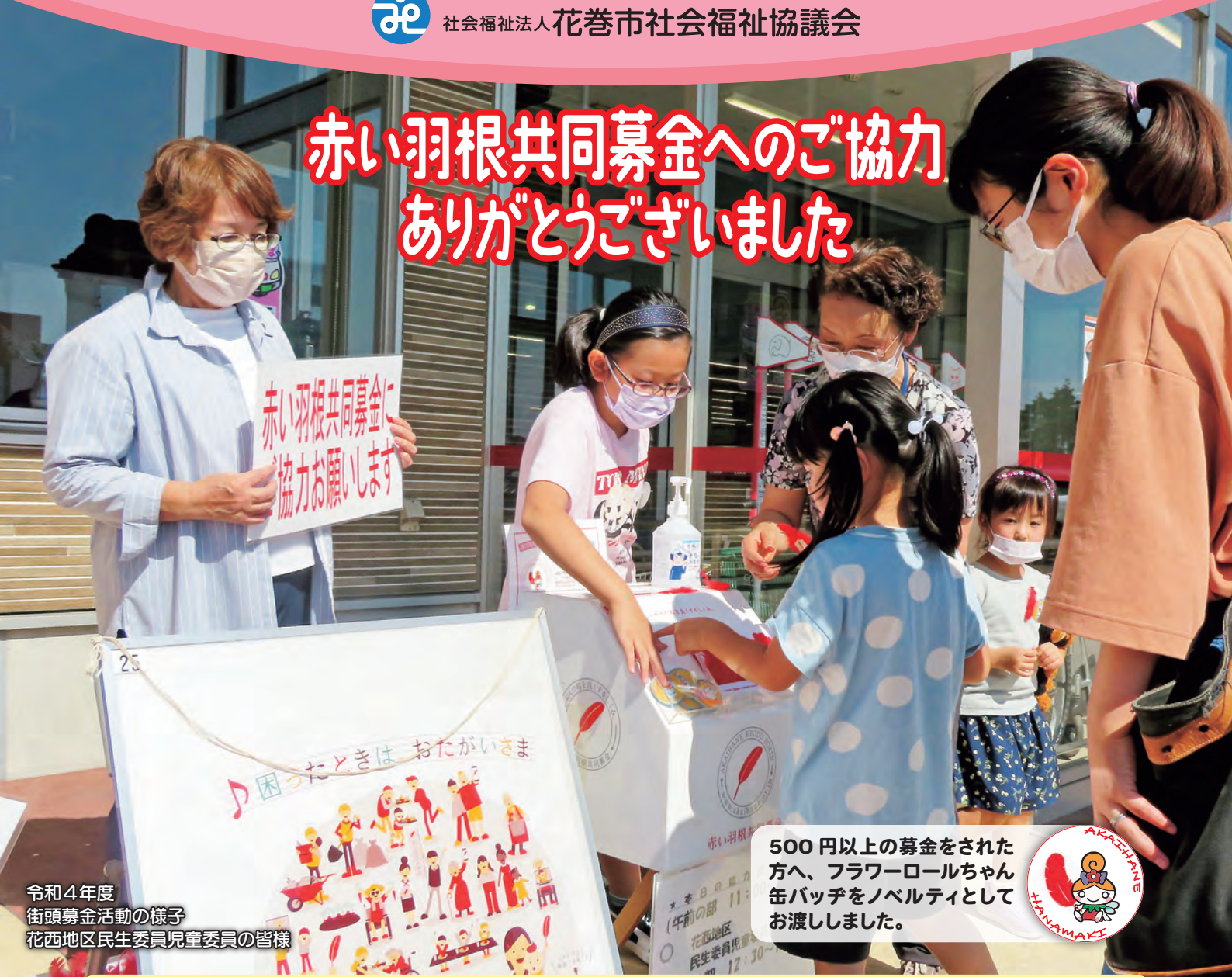
令和4年度 街頭募金活動の様子 花西地区民生委員児童委員の皆様

500円以上の募金をされた方へ、フラワーロールちゃん缶バッジをノベルティとしてお渡ししました。