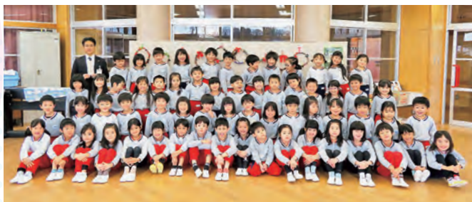
大谷幼稚園の皆様