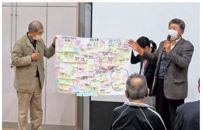
グループ発表の様子