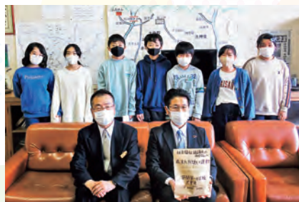
笹間第一小学校の皆様

※1 地域福祉活動配分先団体を募集し、審査決定された5団体では、親子のふれあい交流活動などに役立てられます。 ※2 配分金と事務費を受け入れ額から差し引いた剰余額を、岩手県共同募金会で集約し、次年度の花巻市内の地域活動事業費として再交付されます。