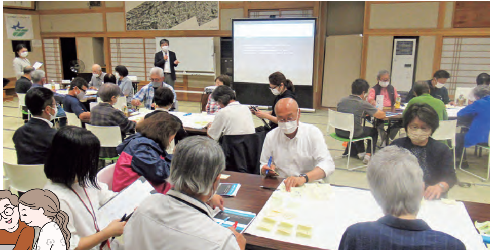
森准教授によるファシリテートの様子