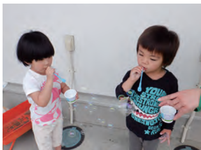
イーハトーブ養育センター活動の様子

障がいのある方の自立支援・社会参加に向けた地域共生社会の実現を推進するため、児童発達支援関係事業を実施し、障がい児等の健やかな成長と発達の支援、日常生活や社会生活での自立に向けた総合的な支援を行い、県南地域の児童発達支援の拠点施設としての役割を果たすよう努めましたが、放課後等デイサービス事業所及び多機能型事業所では、新型コロナウイルス感染症による休業措置等の影響で大幅な減収となりました。