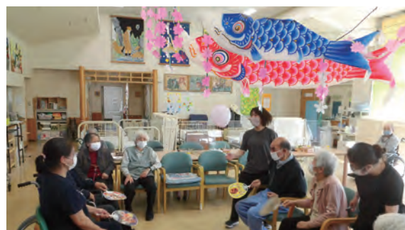
宮野目デイサービスセンター活動の様子

更に、介護予防日常生活支援総合事業の対象となる利用者については、積極的に移行支援に取り組むなど、サービスの専門性を高めました。