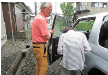
通院の付き添い支援の様子