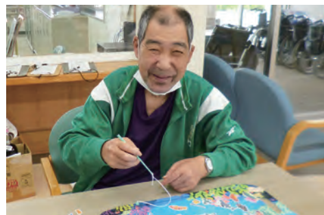
西南デイサービスセンター個別指導の様子

通所介護事業所の併設事業所として実施している障害者基準該当生活介護事業については、サービス提供が定着し、西南・宮野目通所では伸びが見られ、高齢者・障がい者へ一体的に良質なサービス提供が行えました。