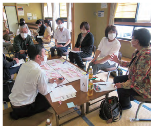
地域福祉懇談会の様子

一方、新型コロナウイルス感染拡大防止のため、様々な事業を縮小・中止せざるを得ない状況もありましたが、多様なニーズに対する住民主体のたすけあい活動、生活支援サービスの創出に取り組む団体との共催事業や支援を行うとともに、各地域のふれあいきいきサロン活動の支援を通して、交流機会の創出や高齢者等の支えあい活動を展開しました。