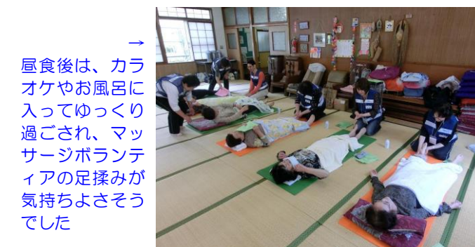
→ 昼食後は、カラオケやお風呂に入ってゆっくり過ごされ、マッサージボランティアの足揉みが気持ちよさそうでした

◆ 8月以降の『地域語りの日』に協力いただけるボランティアを募集しております ◆