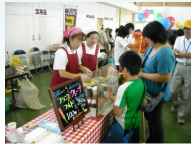
お祭り広場の様子

日時 平成24年 8月25日(土) 10:00~14:00 会場 ビバハウスいしどりや、石鳥谷国際交流センター (どちらも石鳥谷町好地8-78-3) 内容 ・手話、点字、車いす、視覚障がい者体験をしよう! ・縁日コーナー、ふれあい喫茶、模擬店があるよ! ・介護食の試食コーナーや炊き出し体験コーナーもあるよ! ・24時間テレビ協賛募金、東日本大震災義援金募金 ・花北青雲高等学校吹奏楽部による演奏もあります! ※ 参加者全員にチャンス! くじ引き抽選会を行います!! 問い合わせ 花巻市社会福祉協議会本部 電話 24-7222