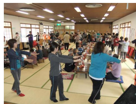
← 午前の部の最後はみんなで炭坑節を踊り、大盛況でした