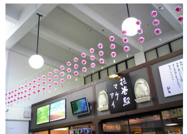
花巻駅の軒花飾り

問い合わせ・注文 障害者就労継続支援B型事業所イーハトーブあけぼの 電話 21-1812 (伊藤・根子)