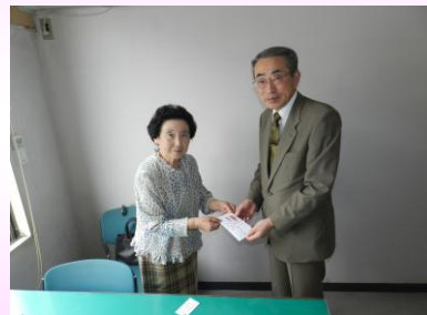
国際ソロブチミスト花巻 様

その他物品として、介護用品等を御寄付いただいた方々に深く感謝申し上げます。また、沢山の古切手・使用済みテレホンカードを御寄付いただいておりますが、ある程度まとまり次第知的ハンディキャップの問題を正しく理解してもらうための啓発活動をしている「誕生日ありがとう運動本部」に送付させていただきます。