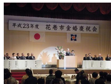
昨年度の金婚慶祝会の様子