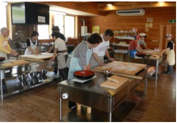
H24 第2回「そば打ち体験」の様子

第3回 日 時 平成24年 8月24日(金) 10:00~11:30 内 容 「和楽器で歌声&読み語り♪」 講師 花巻文化村ボランティア 場 所 花巻市総合福祉センター 研修室 参 加 費 無料