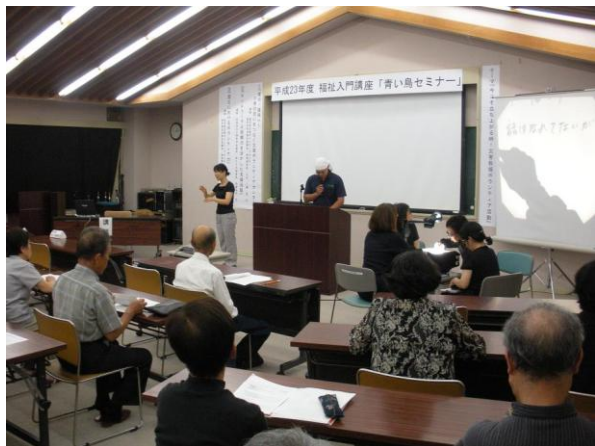
昨年度の講座の様子

日時 平成24年 8月18日(土) 13:00～ 会場 花巻市総合福祉センター 研修室 講座内容 福祉に関する講話 対象 福祉に関心のある方ならどなたでも参加可能 その他 部分受講可能です