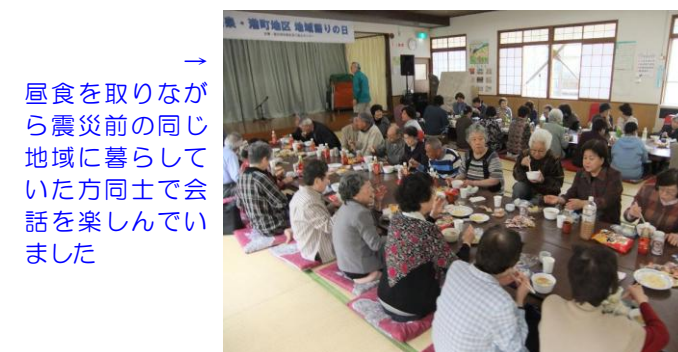
→ 昼食を取りながら震災前の同じ地域に暮らしていた方同士で会話を楽しんでいました