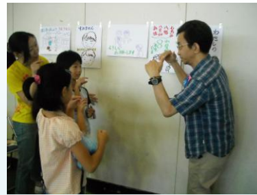
手話体験コーナーの様子