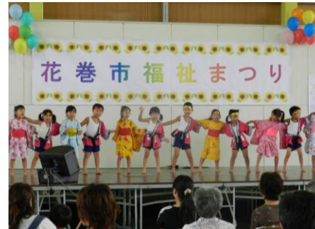
花巻市福祉まつり

花巻市社会福祉協議会は、地域福祉の向上を図るため、地域で抱えている福祉問題を花巻市全体の問題として捉え、市民に必要な情報の提供や、公的な福祉サービスだけでは解決できない生活課題に対応するため、「みんなで考え、話し合い、協力して解決を図ること」を使命に、平成25年度の事業に取り組んで参ります。今月号では、その詳細について御紹介します。