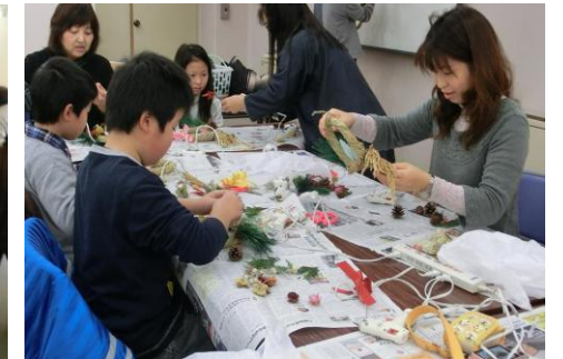
親子ものづくり体験教室