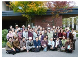
東和支部事業 いろりの会 バスハイク