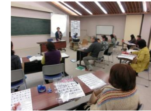
要約筆記ボランティア養成派遣事業