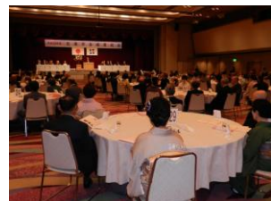
昨年度の金婚慶祝会の様子