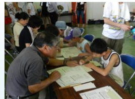
点字体験コーナー