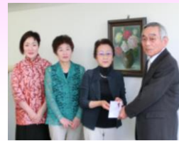
梅木ソーイング教室 様

その他物品として、介護用品等を御寄付いただいた方々に深く感謝申し上げます。また、沢山の古切手・使用済みテレホンカードを御寄付いただいておりますが、ある程度まとまり次第知的ハンディキャップの問題を正しく理解してもらうための啓発活動をしている「誕生日ありがとう運動本部」に送付させていただきます。