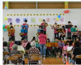
花北青雲高校吹奏楽部