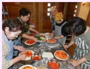
昨年度のピザ作り体験

日時 平成25年 9月19日(木) 10:00~14:00 内容 タルト作り体験 場所 紫波フルーツパーク(紫波郡紫波町遠山字松原1-1-1) 集合時間 9:00までに花巻市総合福祉センターに集合 対象 聴覚に障がいのある方、又はその家族 参加費 1,000円(材料代) その他 エプロン持参