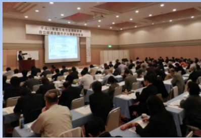
研修会の様子 参加者は皆、真剣に耳を傾けました