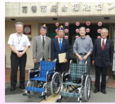
花巻東ライオンズクラブ 様