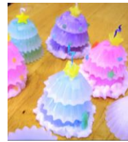
キャンドルアート

募集定員 各教室 親子10組(先着順) 参加料 [材料代] 大人 1,000円 子供 500円 持ち物 陶芸教室のみ ⇒ 手ふき(タオル)持参 申込方法 下記まで電話、FAX、ハガキのいずれかにて親子の氏名、住所、電話番号をご連絡ください。 申し込み先 花巻市社会福祉協議会 花巻市石神町364番地 電話 24-7222 ※ 陶芸作品をお渡しするのは後日になります。 FAX 22-4283 ※ 押し花カレンダーは親子で1枚を作製します。