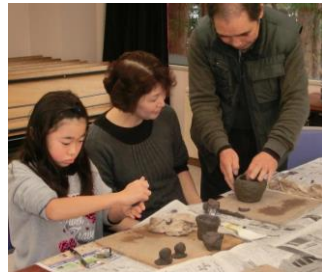
昨年度の手づくり陶芸教室

現代社会の中で忘れ去られようとしている「自分の手で自分の物を造る」という創造の喜びを体験し、思い出となるようなふれあいの時を過ごしていただくことを目的に、第25回親子ものづくり体験教室を開催します。お気軽にお申し込みください。