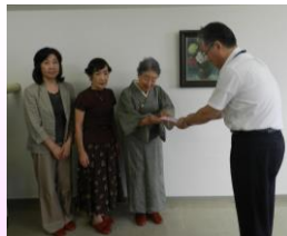
花巻市茶道協会 様

その他物品として、介護用品等を御寄付いただいた方々に深く感謝申し上げます。また、沢山の古切手・使用済みテレホンカード等を御寄付いただいておりますが、ある程度まとまり次第的ハンディキャップの問題を正しく理解してもらうための啓発活動をしている「誕生日ありがとう運動本部」に送付させていただきます。