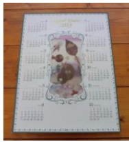
押し花カレンダー