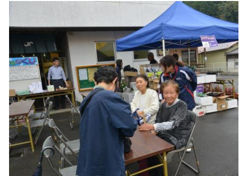
炭火焼ホタテの無料配布に舌鼓

「市日さいぐべ！」詳しい内容については花巻市社会福祉協議会大迫支所（48-4111）までお問い合わせください。