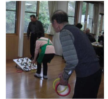
意外に難しい 輪投げ