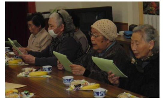
お手製の歌集を見て歌います