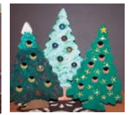
木工(左からコースター、写真立て、ツリー)