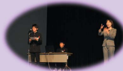
花巻市立矢沢中学校