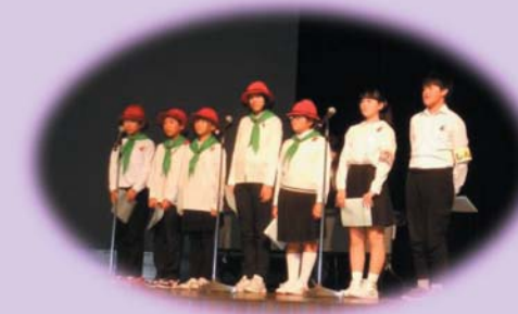
花巻市立内川目小学校6年生

地域の一人暮らしのお年寄りさんのお宅を訪問し、雪かきや窓ふき、草取りのお手伝いをさせていただく「サンキュープラン」実践中。