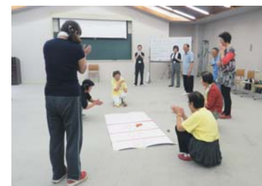
聴覚障がい者との交流 (レクリエーション)

要約筆記とは：発言者の話を聞き、要約して文字で表すことで、聞こえない人にその場の話の内容を伝える通訳のことです。難聴者、中途失聴者などに、会議、授業などの内容を、手話ではなく文字を筆記してコミュニケーションを図ります。中途失聴者とともに高齢者などは、手話を習い覚えるのは大変であり、聴覚障害者の社会参加を促す意味でも、要約筆記の活動が見なおされています。