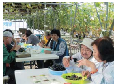
昨年度のぶどう狩りの様子 (視覚障がい者)