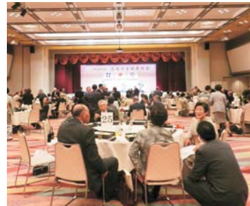
昨年度の金婚慶祝会の様子

【対象者】 結婚50周年のご夫婦 昭和39年4月1日~昭和40年3月31日 の間に結婚されたご夫婦