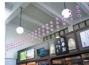
花巻駅の軒花飾り