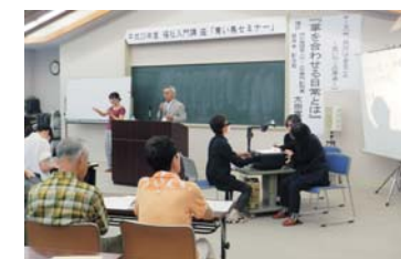
青い鳥セミナーでの要約筆記

うまく要約できずに苦労することもあります。聴覚障がい者の方に「(内容が)わかるよ」と言ってもらえることが励みになっています。