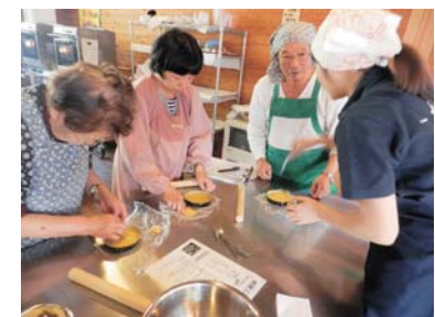
昨年度のタルト作りの様子 (聴覚障がい者)