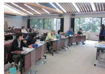
要約筆記ボランティア 養成講座

大人数の会議や講演会だけでなく、個人的な要約筆記にもできるだけ対応いたしますので、ご用命ください。