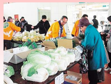
ビバハウスの様子

日時 平成27年11月21日(土) 10:00~12:00 場所 ビバハウスいしどりや 販売商品 衣類、雑貨、食料品など 問い合わせ 花巻市社会福祉協議会石鳥谷支所 電話 45-4666 FAX 46-1171