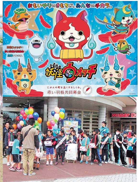
花巻クラブジュニアによる募金活動の様子