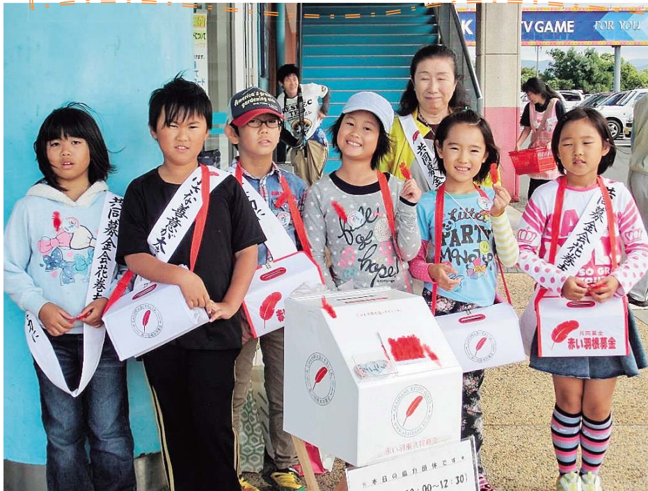
花巻学童クラブによる街頭募金の様子