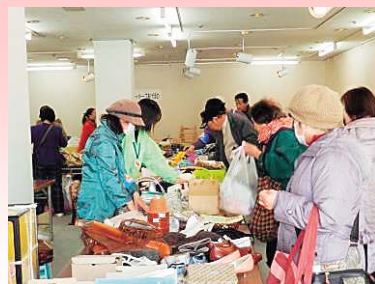
文化会館 展示ホールの様子

日時 平成27年12月6日(日) 10:00~14:00 場所 花巻市文化会館 中ホール・展示ホール 販売商品 家具、衣類、雑貨、市内福祉施設の製品など 問い合わせ 花巻市社会福祉協議会本所 電話 24-7222 FAX 22-4283