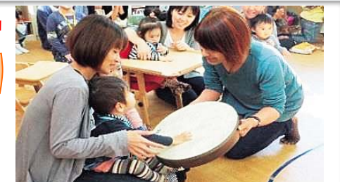
音楽療法での様子

期日：平成27年10月10日(土) 10:00~14:00 場所：花巻市総合福祉センター内 イーハトーブ養育センター 問い合わせ：イーハトーブ養育センター 電話 21-3771