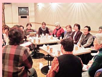
家族介護者日帰りリフレッシュ事業