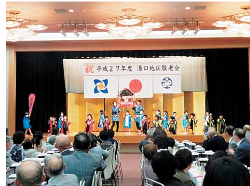
湯口地区での アトラクションの様子