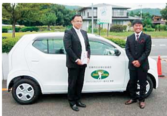
プロゴルファー 宮里優作 様(右側)

今年度、JPA様のご厚意により岩手県内に10台の車輦の寄贈を受け、うち1台を花巻市社会福祉協議会に寄贈いただきました。今後の活動に役立てさせていただきます。大変ありがとうございました。