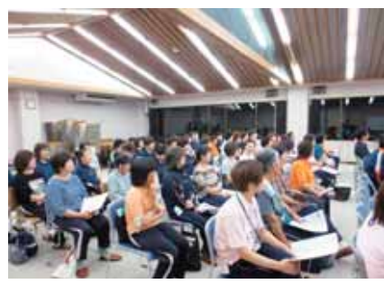
《法令遵守・交通安全の研修の様子》