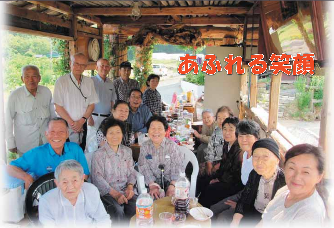
矢沢支部 下駒板五日会サロンのようす