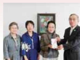
梅木ソーイング 様