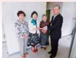
国際ソロプチミスト花巻 様