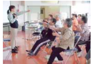
＝ 成島地区での取り組み ＝

「元気でまっせ体操」に取り組んでみたい方は、各地域包括支援センターまたは花巻市長寿福祉課へお気軽にご相談ください。