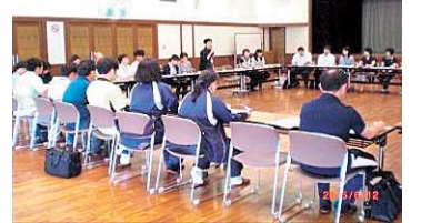
東和地域支援ネットワーク会議の様子

東和地域…東和地域支援ネットワーク会議を定期的開催しています。今年度も第1回目を6月12日(金)に開催しました。今年度1回目ということもありそれぞれの事業所の紹介などを通して情報交換をしました。また花巻市長寿福祉課より「介護保険改正に伴う生活支援サービスの構築について」説明いただきました。