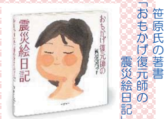
「おもかげ復元師の震災絵日記」笹原氏の著書

日時 平成27年8月8日(土) 13:30~15:30 場所 花巻市総合福祉センター 研修室 (講演終了後 30分質問コーナー) 対象 福祉に関心のある方 参加費 無料 ※ 手話通訳・要約筆記通訳がつきます 申し込み 花巻市社会福祉協議会本所 または FAX にてご連絡ください。 花巻市石神町364 電話 24-7222 FAX 22-4283