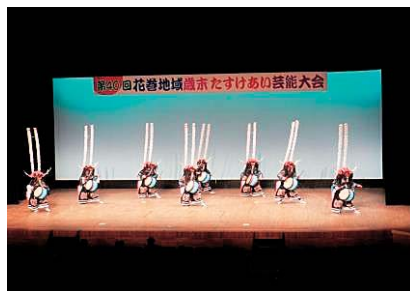
昨年度の鹿踊りの様子