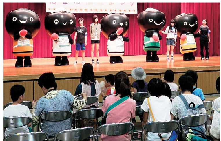
花巻福祉まつり いわて国体PRの様子