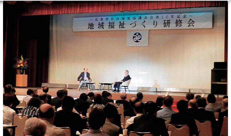
地域福祉づくり研修会での会長対談の様子