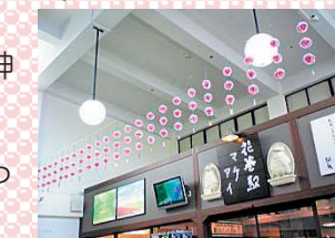
花巻駅の軒花飾り