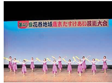
昨年度の出演団体の様子