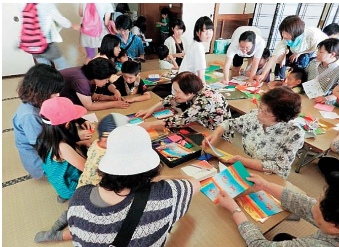
花巻福祉まつり 折り紙コーナーの様子