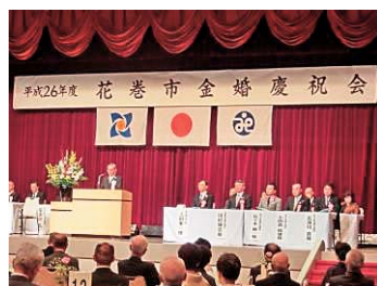
昨年度の金婚慶祝会の様子