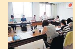
地域ケア会議の様子