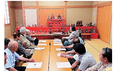
語り継ぐ会 ひなまつりの様子

大迫地域…セーフティネット事業を活用した「語り継ぐ会・ひなまつり」を開催しています。地域の伝統行事の掘り起しや昔話など思い思いに語り懐かしさや笑みが溢れています。「語り継ぐ会」の様子を冊子とDVDにし、世代交流への取り組みに活用していき、事業を継続していきます。