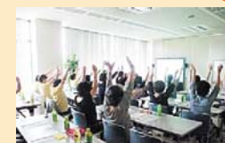
認知症サポーター養成講座の様子