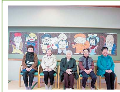
創作活動作品 貼り絵の大作「七福神」 情報誌「月刊デイ」に入賞しました。

看護師、介護員が、健康チェック、入浴、創作活動、昼食などのサービスを提供します。地域のみなさんとの交流や季節毎の行事など、より良いサービス提供を心がけております。