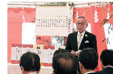
施主・会長の挨拶