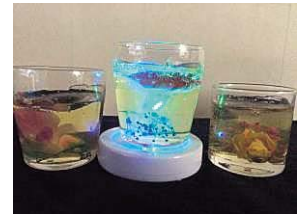
↑フラワーキャンドル

募集定員 各教室 親子10組(先着順) 参加料 大人 1,000円、子供 500円(材料代) その他 汚れても良い服装でお越しください。 ※電動工具等は使用しません。