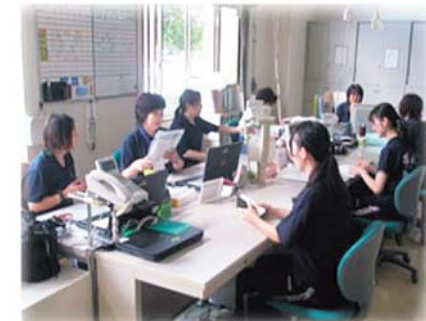
ヘルパー訪問前のミーティング

花巻市社会福祉協議会では、岩手県立大学からの実習生を毎年数名受け入れております。今年度は9月に2名の学生が介護保険制度の勉強のために介護センターで実習を行いました。訪問介護事業、居宅介護支援事業では、家庭訪問同行などにより、制度の役割や、人と人との対話の大切さを学んでいただきました。