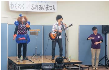
アンダーパスの音楽ライブ