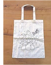
↑おえかきトートバック