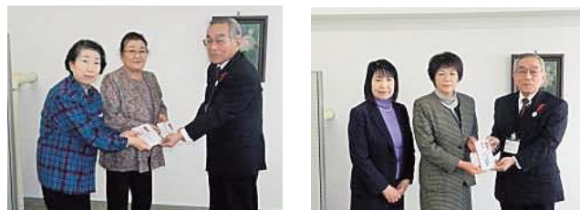
妙圓寺 仏教婦人会 様