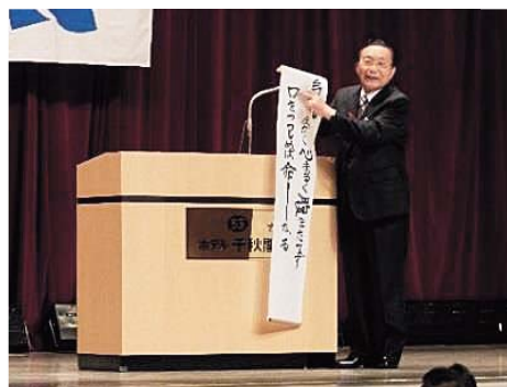
笹間地区の米寿代表謝辞