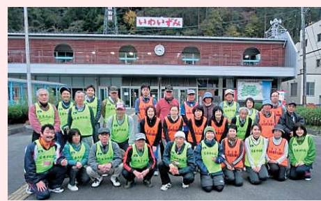
第2次ボラバス協力者