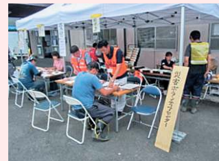
ボランティア受付

現地での支援内容は、主に北上市社会福祉協議会、西和賀町社会福祉協議会との合同による、全国各地からの災害ボランティアを受け入れるための災害ボランティアセンターの窓口受付に従事し、ボランティアの皆様の心温まるご支援をいただきました。