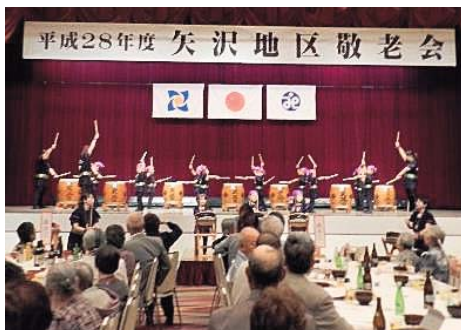
矢沢地区のアトラクション

ご参加された皆様が、今後もますます、お元気で過ごされますようご祈念申し上げます。