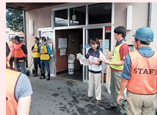
活動先のマッチング