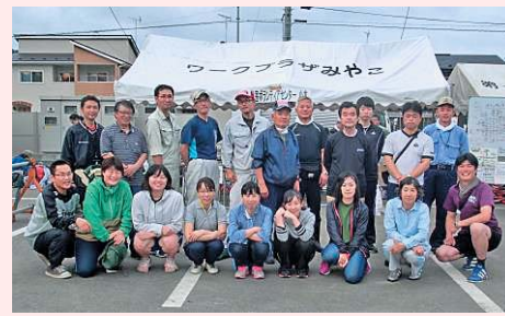
第1次ボラバス協力者