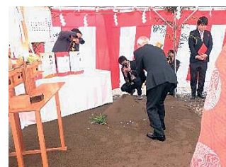
会長による 納入の儀

建設工事完了予定は、平成29年3月15日となっています。平成29年度4月の開所に向け関係者一丸となって取り組んで参りますので、引き続きご理解とご支援をお願いします。