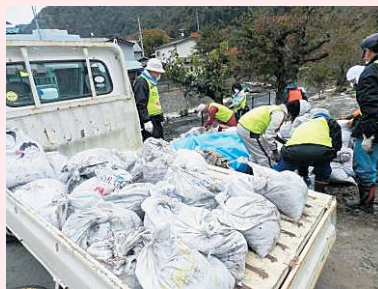
河川敷からの土嚢運搬