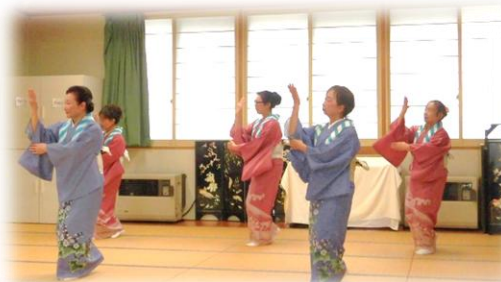
花巻民踊研究会 様