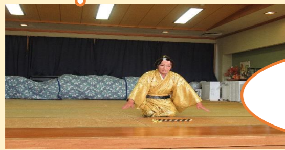
虹の会様 衣装も素敵でした